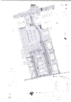
Propunere localizare Spatii Gospodaresti - SM, Str. Paulesti, Nr. Cad. 167572, 155793.JPG 178K

www.primariasm.ro SITE GLS www.primariasm.ro