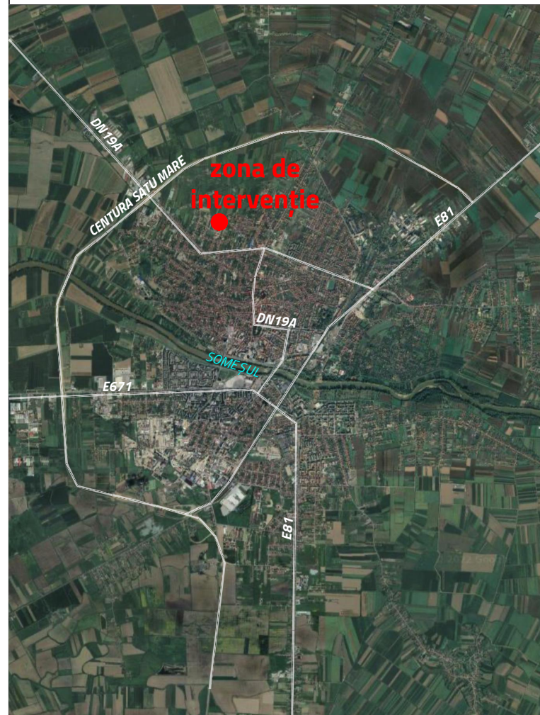
ÎNCADRARE ÎN MUN. SATU MARE