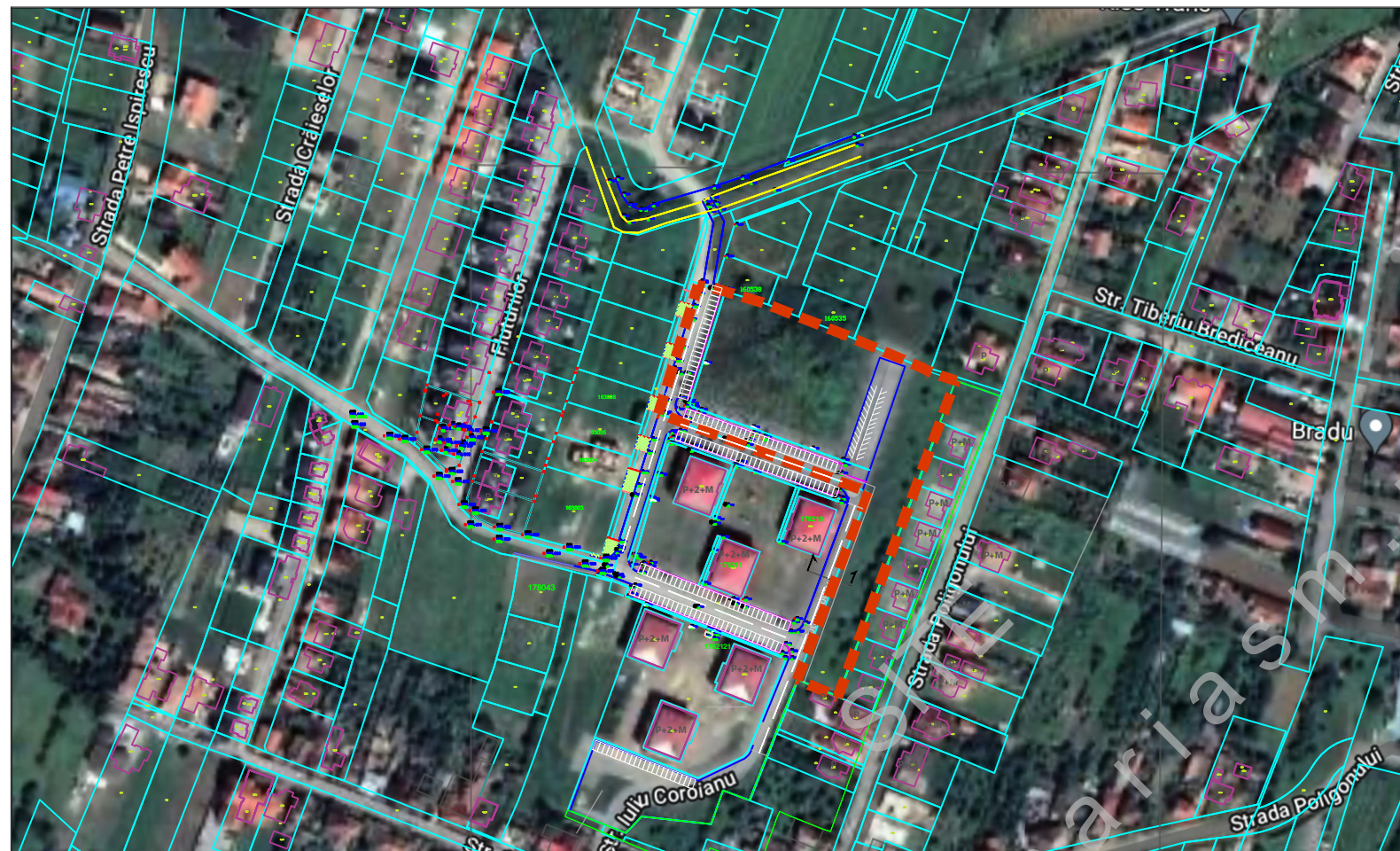
ÎNCADRARE ÎN ZONĂ

Terenul se încadrează conform PUZ-ului menționat în certificatul de urbanism nr. 574 din 13.08.2020 în subzona IS, teren cu interdicție temporară de construire pentru orice funcțiune de tip IS până la elaborare și aprobare PUD.